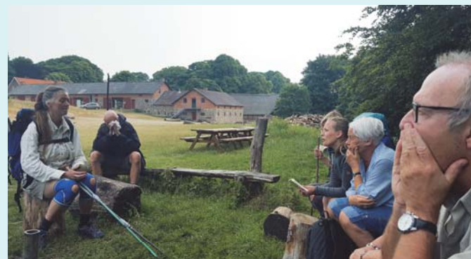
Morgenandagt inden dagens pilgrimstur på 25 km.