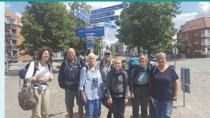
Gruppen der i juni var på pilgrimsvandring på Hærvejen