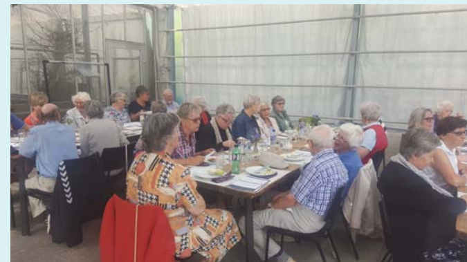
Samværsklubbens årlige Sommerudflugt.